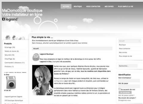
Figure 1-8 Le site Legrand Boutique