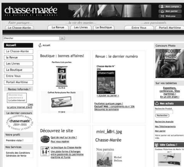
Figure 1-9 Le site Chasse-Marée

Voici d'autres exemples de boutiques, sélectionnées pour leur originalité et leur convivialité :