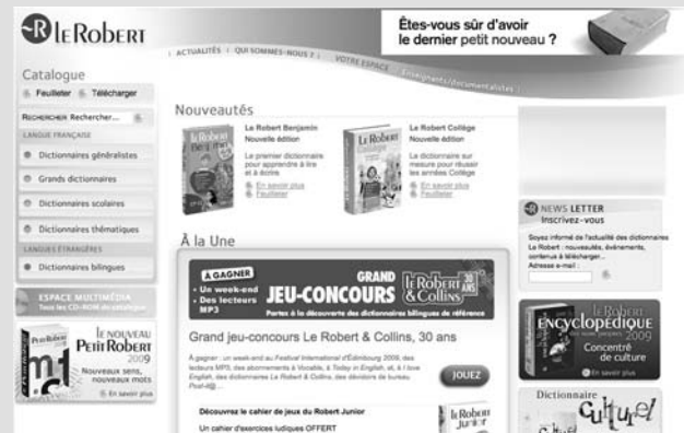
Figure 1-5 Le site des dictionnaires Le Robert

▶ http://fevad.com/ site de la Fevad (figure 1-6).