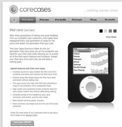
Figure 1-11 Le site Corecases