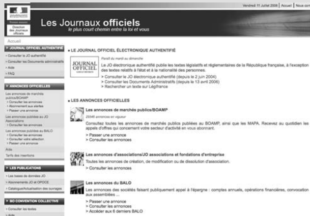
Figure 1-4 Le site du Journal Officiel

▶ http://www.journal-officiel.gouv.fr/ site du Journal Officiel (figure 1-4).