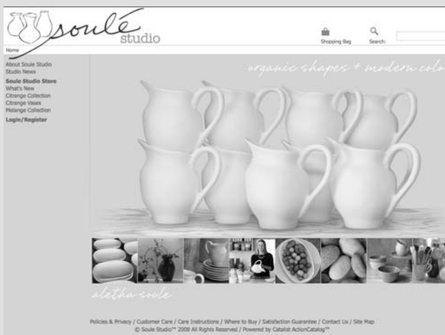
Figure 1-10 Le site Soulé Studio