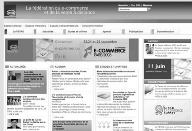
Figure 1-6 Le site de la Fevad (Fédération de l'e-commerce et de la vente à distance)

▶ http://fevad.com/ site de la Fevad (figure 1-6).